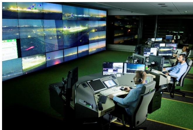
3.ábra A HungaroControl rTWR CWP éjszakai tesztelés során

ugyanis két egymással párhuzamos futópálya vizualizációját kell megvalósítani, a jelenleg is rendszeresített kiszolgáló és támogató (légiforgalmi irányítói és tájékoztató 15 , CNS 16 , meteorológiai, légtér-gazdálkodó és áramlásszervező) rendszerek integrálásával, és videófal-jellegű vizualizációval.