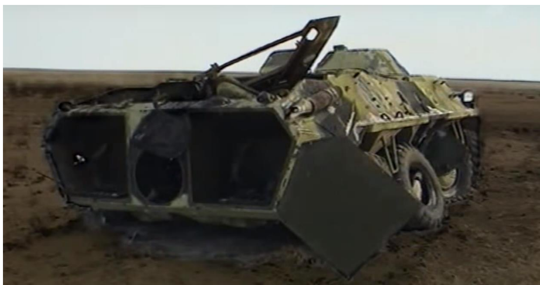
6. ábra Egy harcjármű a robbanás után.

Valószínű nem azonos az előző képeken láthatóval, mert nincs mögötte épület [12]