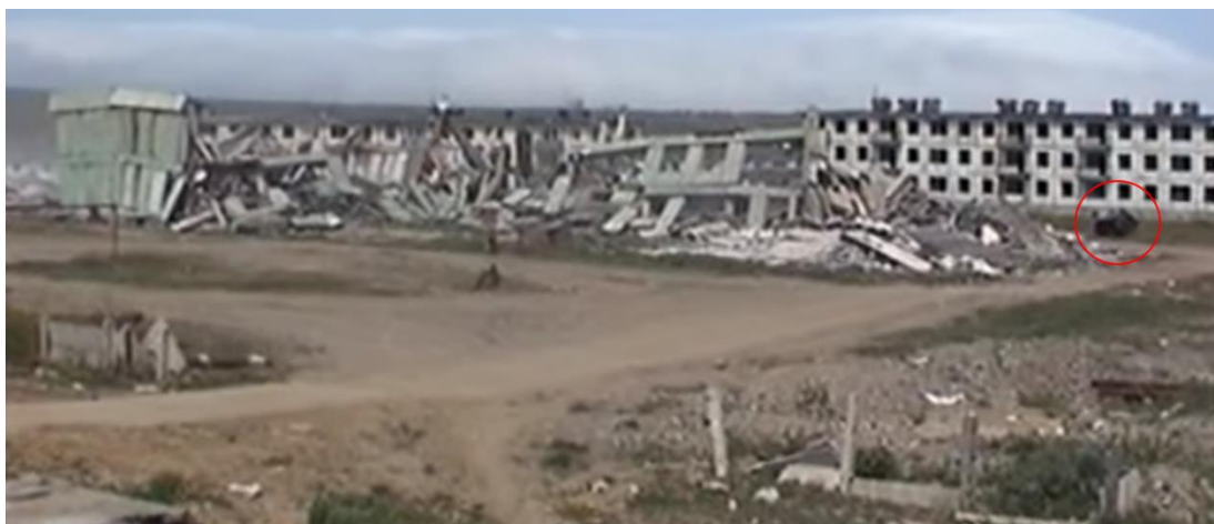
5. ábra A robbantási területen található épület a robbantás után [12]