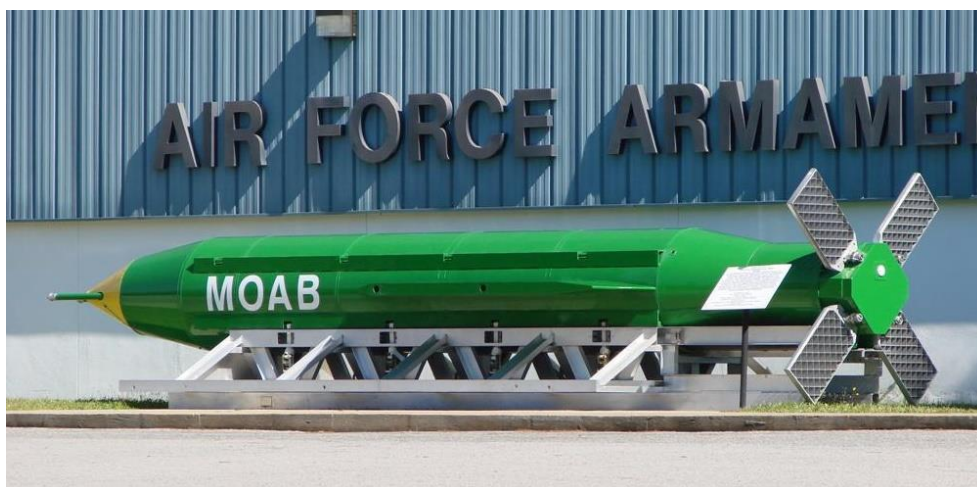
8. ábra MOAB [8]

A kialakításukban van látható különbség (3. és 8. ábrák). A MOAB inkább egy nagyméretű rakétára hasonlít, rácsos stabilizátor felületekkel, melyek szállítási helyzetben behajthatók.