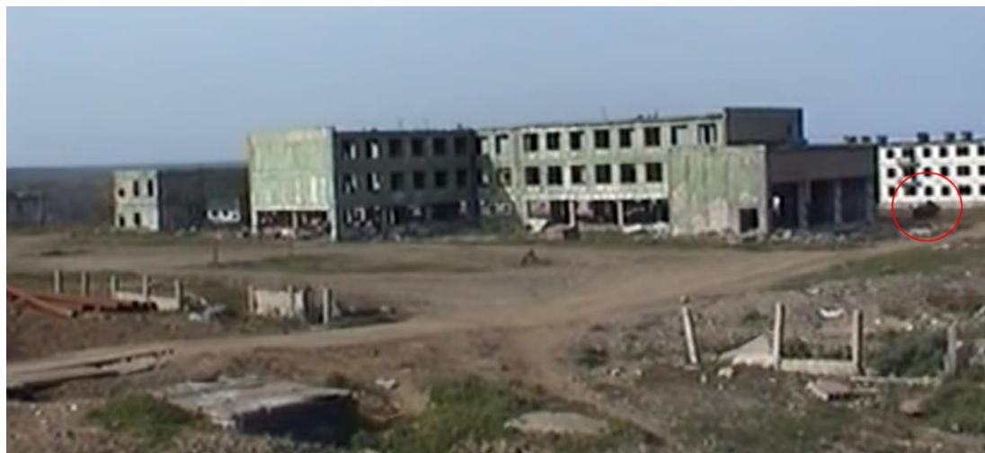
4. ábra A robbantási területen található épület a robbantás előtt. Pirossal bekarikázva valószínű, hogy egy harcjármű látszik a képen [12]

A fenti adatokat jól szemlélteti a Первый Канал (Egyes csatorna) orosz televízió, a 2007. szeptember 11-én végrehajtott kísérleti robbantásról készült tudósításából kivágott képek (4–7. ábrák):