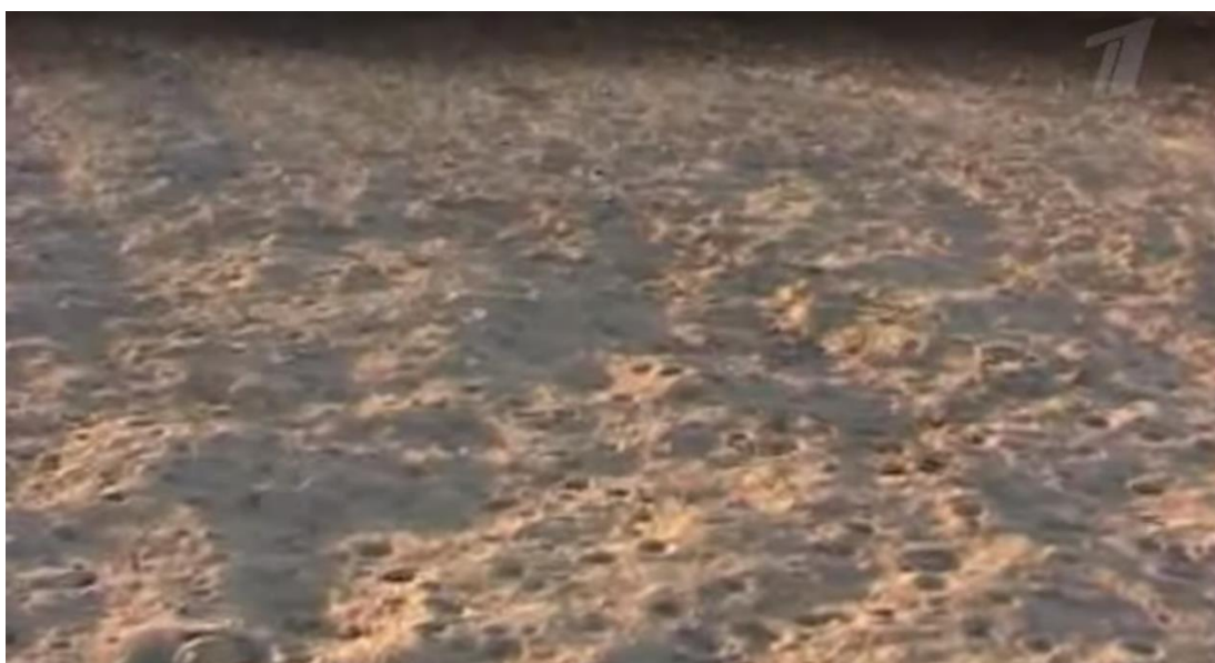
7. ábra A robbantási terület a kísérlet után. Jól látható, hogy nem keletkezett bombatölcsér [12]

Valószínű nem azonos az előző képeken láthatóval, mert nincs mögötte épület [12]