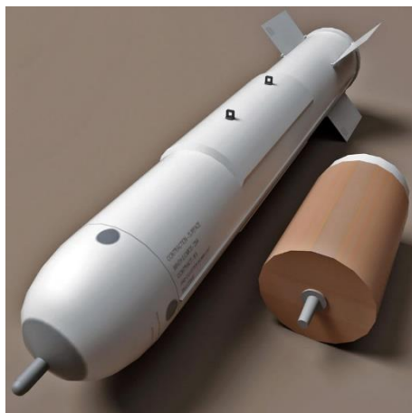
1. ábra CBU-72/BLU-73 FAE bomba [6] [9]

és 75 lb (34 kg) ethilén-oxid-ot tartalmaznak, melyet a cél fölött kb. 9–10 m magasan robbannak fel [3] [4] [5].