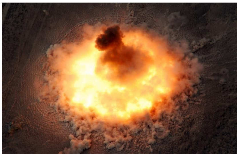
2. ábra A FOAB gombafelhője [14]

A bomba új fejlesztésű, nagy hatóerejű robbanóanyagot tartalmaz. Hatóereje 44 t TNT ekvivalensnek felel meg. A robbanás során a hatása hasonló, mint a kisméretű, harcászati nukleáris töltetké, ami szuperszonikus terjedési sebességet és igen magas hőmérsékletet jelent. A 2. ábra a bomba robbanása során keletkező gombafelhőt mutatja.