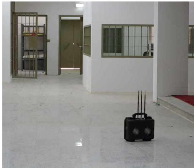
1. ábra Hordozható elektronikai zavaróeszköz egy börtönön belül elhelyezve [8]