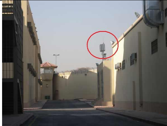
2. ábra Fixen telepített elektronikai zavaróeszköz egy börtön külső falánál [9]