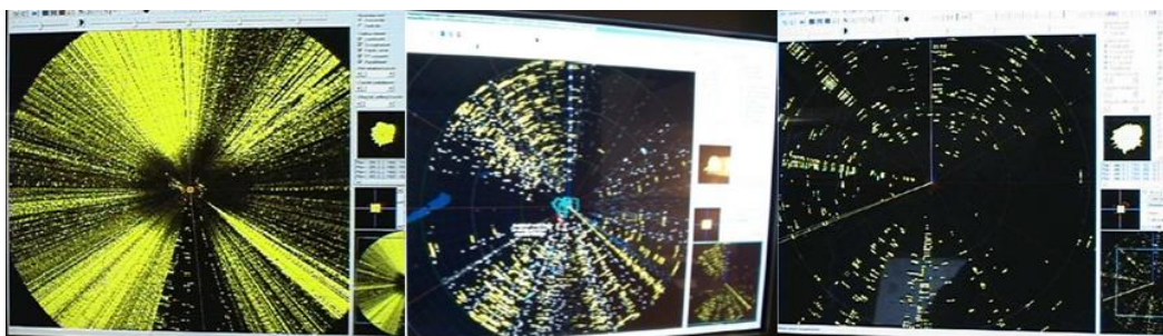
5. ábra Aktív zajzavar, aszinkron és szinkron válaszipulzus-zavar az SzT-68U/M 5 képernyőjén [17]

A megfelelő paraméterek ismeretében lehetséges a POD-ok beprogramozása hatásos zavarásra, és ha nem is teljes mértékben fogják le a céleszközöket, a kezelők munkáját képesek bonyolulttá tenni.