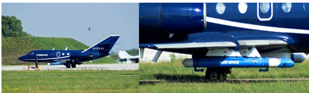
4. ábra COBHAM Aviation repülőgépe és a szárny alá függesztett zavarókonténer (POD) [16]

A Magyar Honvédség NATINADS 4 feladatba bevont erői részvételével megrendezésre kerülő elektronikai hadviselési gyakorlaton az elektronikus zavarást repülőgépekre szerelt zavaró konténerekkel, úgynevezett POD-okkal biztosítják (4. ábra), melyek az előzetes egyeztetések alapján kerültek felprogramozásra. A zavaró POD-ok többféle típusú elektronikus zavar generálására képesek, ezen különböző zavarok radarkijelzőkön látható hatásainak néhány példája a 5. ábrán látható. [15]